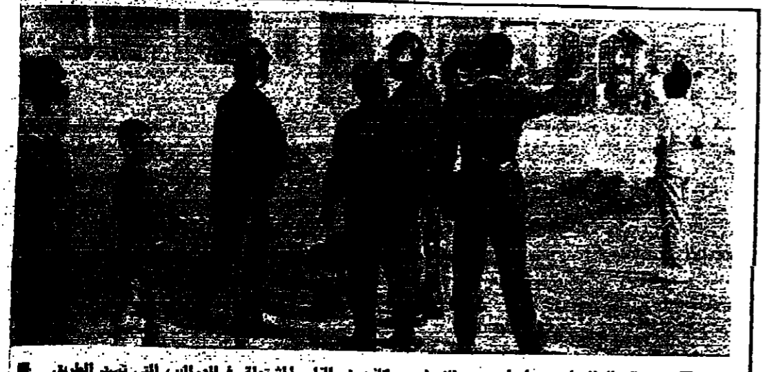
رجال الاطفاء وسط طرسيق الزواي يكفون النار المشتعلة في الدواب التي ضد الطريق

لسان وزير الامم : ان موضوع التبادل الحكومي سوف لا يطرح على بساط البحث قبل الاسبوع التالي . من ايار المقبل ، اي بعد عطلة الاعياد ، حين المستعد وتوقع أزمة خلال جلسة مجلس الوزراء هذا الاسبوع ، في حال انعقادها لان المبعوثين يدركون ان لا جسر لتفجير الأزمة طالما ان الحكومة قد تنازلت عنها ، من غير ما حجة لتفجيرها من الداخل . ( التفاصيل على الصفحة ٢ )